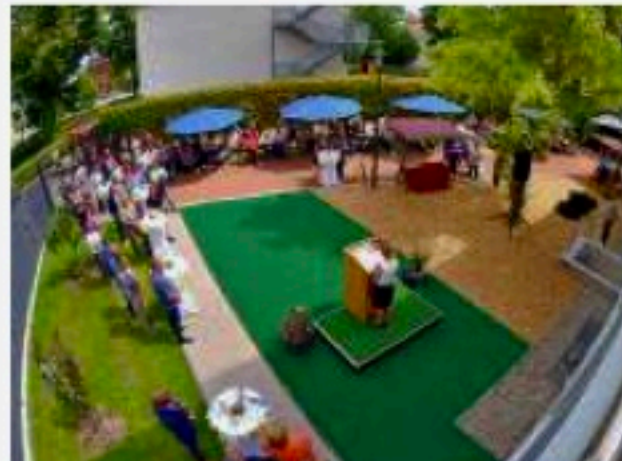
Bürgermeisterin, Stadträte, Mitarbeiter und Bewohner beim Gartenfest.

Für die Bewohner des Hauses „Am Schlossplatz“, das 1897 als Schulhaus errichtet wurde und einst auch Unterkunft für Bausoldaten war, gebe es nun helle, moderne Zimmer. Dafür wurde es vom Keller bis zum Dachgeschoss saniert. Auf drei farblich unterschiedlich gestalteten Etagen können je sechs Männer und Frauen in Einzelzimmer ziehen, ganz unten im geschützten Bereich. Für jede Wohneinheit gibt es eine Küche, Aufenthalts-