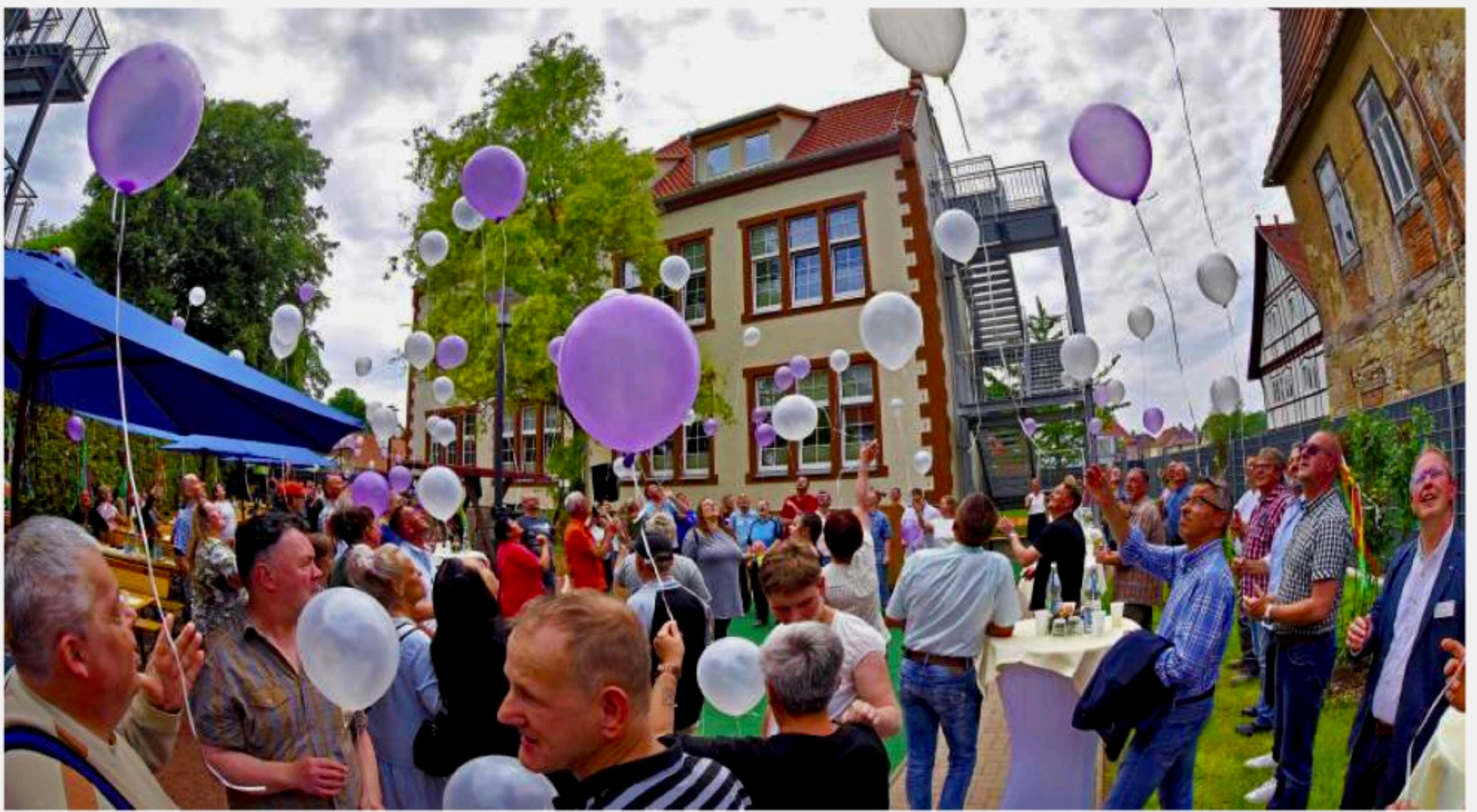
Mit den Luftballons in Stiftungsfarben und einem Gartenfest wird in Hoym ein neuer Wohnbereich für Autisten übergeben.