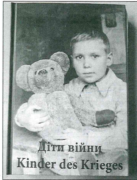
Ansicht des Buches „Kinder des Krieges“